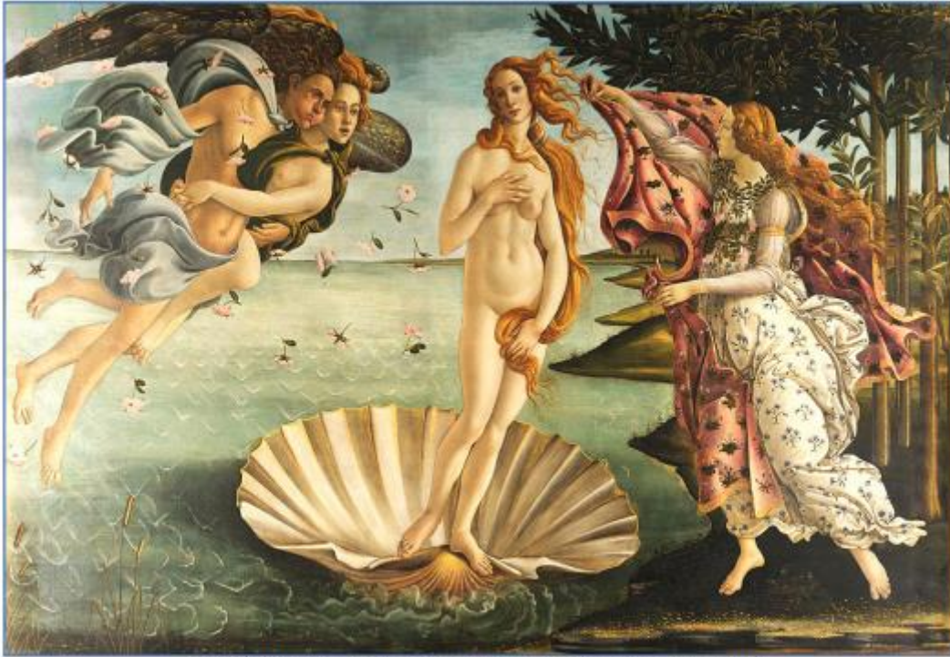
Pintura El nacimiento de Venus (Sandro Botticelli, circa 1484)

a. Establece semejanzas y diferencias entre ambas obras del Renacimiento.